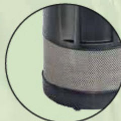
Beta 1200 mit Direktansaugung