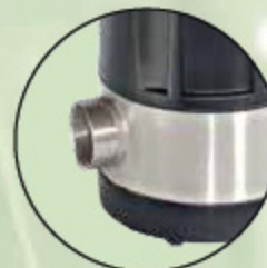
Beta 1200 X mit 1/4"-Stutzen