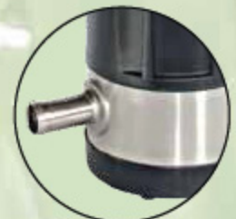
Beta 1200 T mit 1"-Tülle