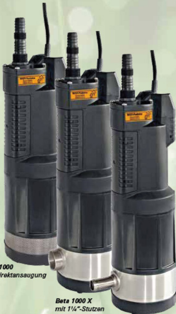
Beta 1000 mit Direktansaugung